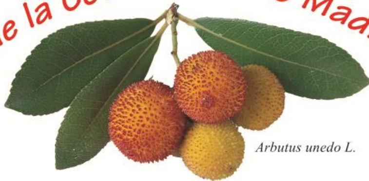
Arbutus unedo L.